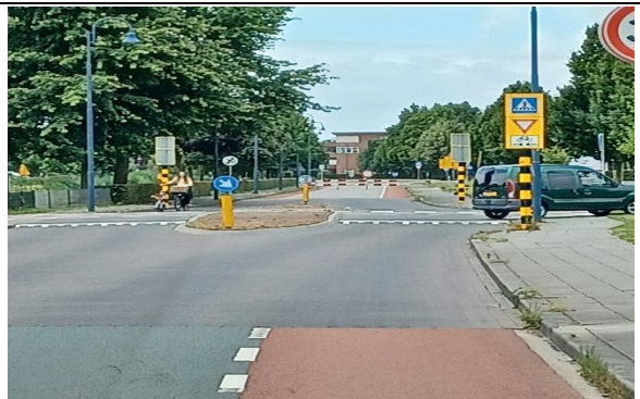
Burg.Labreeweg zichtbare nwe bebording