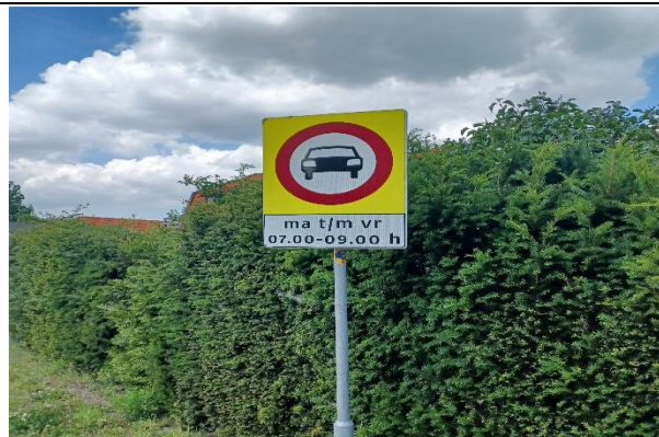
Sluiproute beperkte tijden, Achterveld