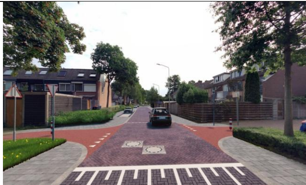
Kruispunt Rooseveltlaan + pianomarkering