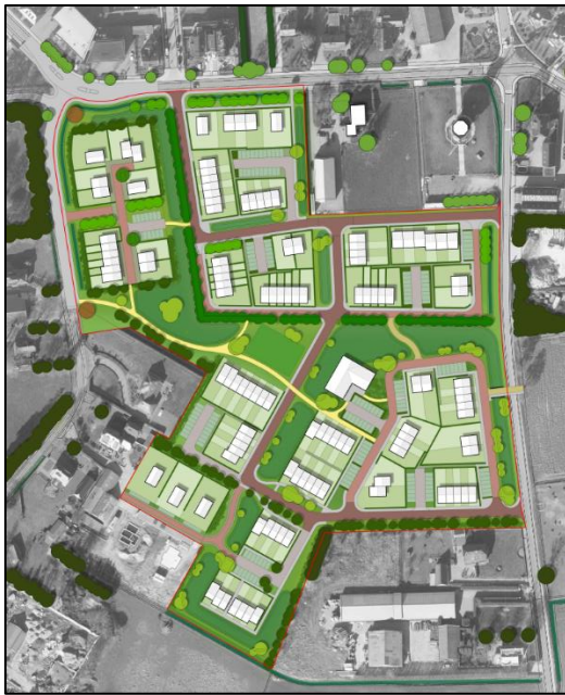
Schetsontwerp herontwikkeling Puurveenseweg/Walhuisweg in Kootwijkerbroek

Onderstaande afbeelding toont het huidige stedenbouwkundige schetsontwerp.