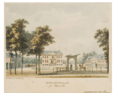
Afbeelding 4. Voorgevel en landgoed huis Schaffelaar getekend door H. Numan.

Ontwikkelingen op het landgoed zouden voort kunnen bouwen op de kenmerken van de verschillende periodes waarin het park is aangelegd. Onderstaand een beschrijving van de stijlkenmerken van deze periodes uit de Uitvoeringsrichtlijn Hovenierswerk Historische tuinen en parken van de ERM.