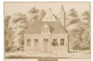
Afbeelding 3. Huis Hakfoort.