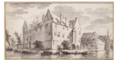
Afbeelding 2. Kasteel Hackfort.